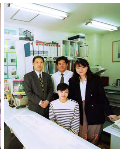
●シティ・ハウジング設立当時の店舗写真